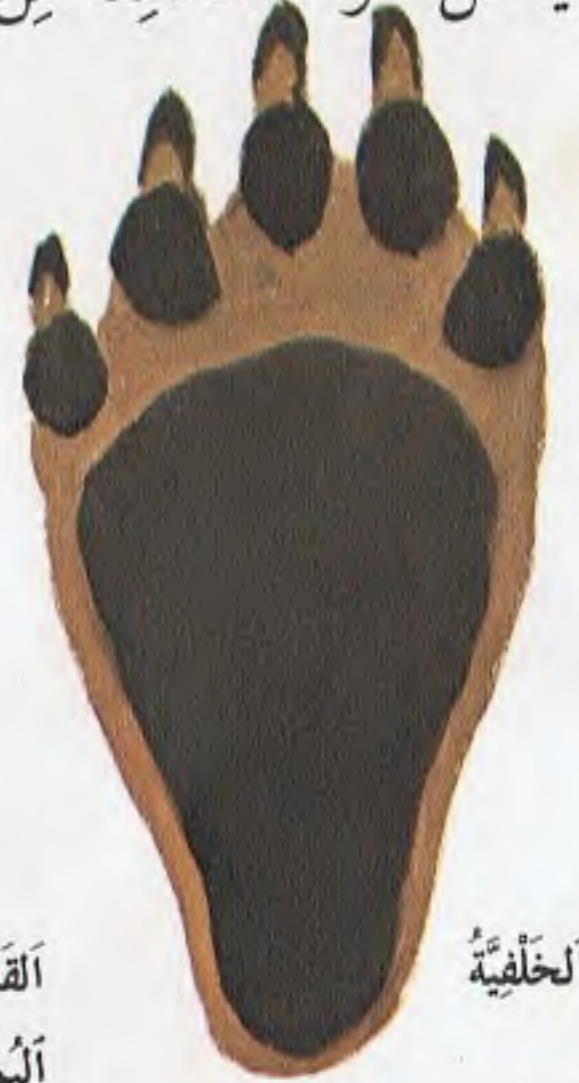
الْقَدَمُ الْخَلْفِيَّةُ الْيُمْنَى

أَثَرُ قَدَمَيْ الدَّبِّ الْيُمْنَيْنِ الْأَمَامِيَّةِ وَالْخَلْفِيَّةِ . لَا حَظَّ لِأَصَابِعِ الْخَمْسِ فِي كُلِّ قَدَمٍ ، وَالْبَرَّائِنِ الطَّوِيلَةِ (وَهِيَ سِلَاحُ الدَّبِّ الرَّئِيسِيِّ) فِي كُلِّ إِصْبَعٍ .